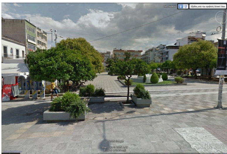
Λαμία: Πλατεία Πάρκου

Θυμάμαι οι περισσότεροι των συναδέλφων μου- πρώτος και καλύτερος εγώ- για να μη