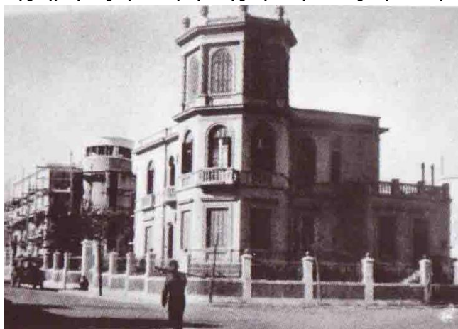
ΡΟΔΟΣ: Ο Πύργος της Πλατείας Κύπρου

Φαρμακεία τους και τόσοι άλλοι ελεύθεροι επαγγελματίες, χωρίς να φοβούνται κλοπές, χωρίς να φοβούνται ληστείες, χωρίς να φοβούνται να κουβαλούν πάνω της τις εισπράξεις της ημέρας ή ακόμη της εβδομάδας ή και μηνών.