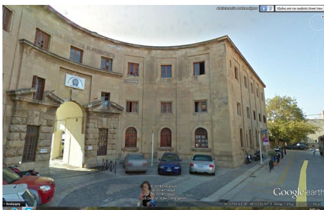
ΡΟΔΟΣ: Δέκα οκτώ(18) νεανικά χρόνια (1947-1965)

Υπαξιωματικών όταν και εγώ εκεί εκπαιδευόμουν το 1950, μας έλεγε. Θα εισηγηθώ στον κ. Αρχηγό να εκδώσει διαταγή στα υφιστάμενα κλιμάκιά του να μη σας τιμωρούν όταν καθημερινά και για πολλές ώρες ίσως σας πιάσουν να κάθεστε στα καφενεία των χωριών, κωμοπόλεων ή και πόλεων