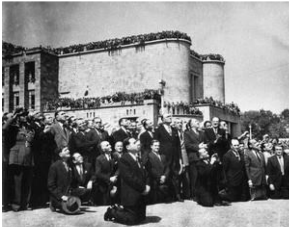
ΡΟΔΟΣ:31-3-1947.Τι άλλο να πείς, από το σ' ευχαριστώ ΘΕΕ ΜΟΥ !!

Τα νησιά της Δωδεκανήσου Ρόδος, Σύμη, Κως, Κάλυμνος, Λέρος, Πάτμος, Κάρπαθος, Κάσος, Καστελόριζο κ.λ.π. (στο διάταγμα αναφέρονται ονομαστικά όλα τα νησιά και βραχονησίδες) από 28 Οκτωβρίου 1947 προσαρτώνται στην Ελλάδα. Το δε παρών