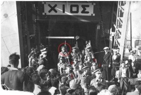
Στο λιμάνι της Ρόδου, απόγευμα 29 Μαρτίου 1947. Άνδρες της Χωροφυλακής εξέρχονται του "Χίος". Εγώ στον κύκλο.

Το απόγευμα της ίδιας μέρας το αρματαγωγό μπήκε στο Λιμάνι του