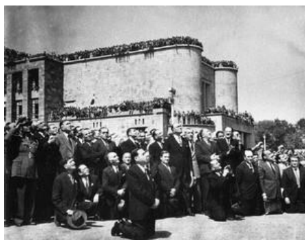
ΡΟΔΟΣ:31-3-1947.Τι άλλο να πείς, από το σ' ευχαριστώ ΘΕΕ ΜΟΥ !!

Η παράδοση των νήσων έγινε στις 12 το μεσημέρι τις 31 Μαρτίου 1947