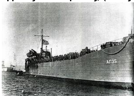
Απόγευμα 29/3/1947 άφιξη στην Ρόδο. Το κατάστρωμα του "Χίος" γέμισε με χωροφύλακες!

καταλύσαμε μέχρις ότου παραλάβουμε τα αστυνομικά τμήματα από τους Άγγλους αστυνομικούς, (Μάιος 1945 μέχρι το Μάρτιο 1947 αστυνόμευαν στα Δωδεκάνησα).