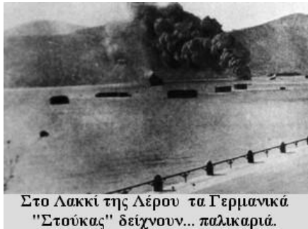
Στο Λακκί της Λέρου τα Γερμανικά "Στούκας" δείχνουν... παλικαριά.

Στις 27 Μαρτίου 1947, στο λιμάνι «Σκαραμαγκά», δύναμη περίπου 600 ανδρών Χωροφυλακής επιβιβάστηκε στο αρματαγωγό "ΧΙΟΣ" με προορισμό τα Δωδεκάνησα.