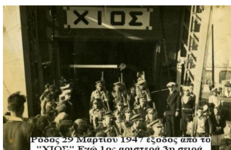
Ρόδος 29 Μαρτίου 1947 εξόδος από το "ΧΙΟΣ". Ενώ 1ος αριστερά 3η σειρά

κωδωνοκρουσίες τους, τα σφυρίγματα πλοίων, οι καραμούζες και τα α