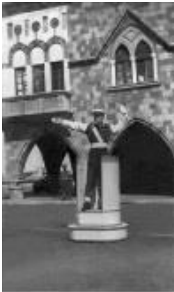
ΡΟΔΟΣ 1947 (Υπηρεσία στη Στρατιωτική Διοίκηση)

αστυνομικά καταστήματα στους δικούς μας προϊσταμένους. Μάλιστα σε ένα εξ αυτών εγώ προσωπικά/ στο πρώτο αστυνομικό τμήμα που ήμουνα τοποθετημένος /υπηρεσία τροχαίας/,για να συνέλθει έτρεξα και το έφερα νερό.