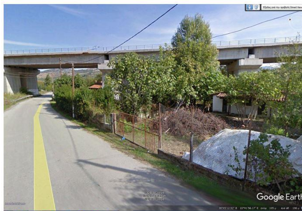
ΚΟΜΝΗΝΑ: Η καινούρια γέφυρα του τραίνου.

Σήμερα όμως, πάνε και έρχονται τα κάθε είδους τροχοφόρα, χώρια που οι κάτοικοι αυτού του όμορφου πλέον-τότε- λασποχωριού, εδώ και ένα τρίμηνο καμαρώνουν τα τραίνα που τρέχουν πάνω στις νέες τους γραμμές τοποθετημένες σε μια μεγάλη γέφυρα