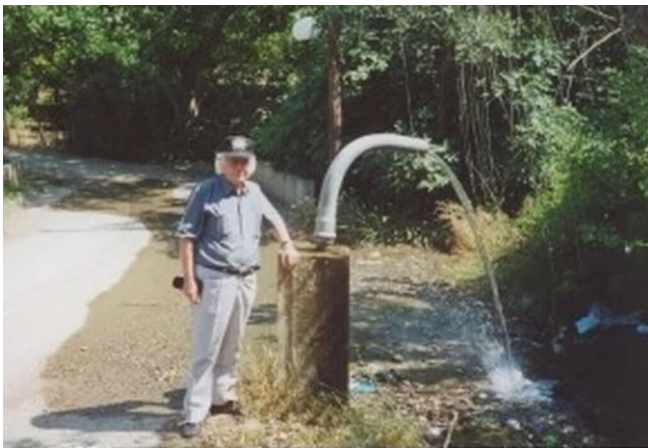
Η Κόμνηνα κάποτε δεν είχε νεράκι. Τώρα ως Θείο Δώρο τρέχει έφθονο!!

Οι όποιες κατά καιρούς μαγκουριές του, προς όλα τα παιδιά του, εκείνη την εποχή, είχαν σκοπό διαπαιδαγώγησης και όχι μίσους, έτσι πίστευαν