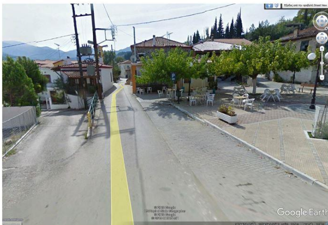
Η τωρινή πλατεία του χωριού μου, της Κόμνηνας, στην οποία, τα παλιά δικά μου χρόνια, υπήρχε μία και μοναδική βρύση( το χωριό είχε και άλλα 4-5- πηγάδια), το γάργαρο και κατακάθαρο νερό της οποίας με ορμή έτρεχε, στο πάντα βρώμικο αυλάκι της κατηφόρας που ήταν γεμάτο σφήκες και άλλα έντομα.