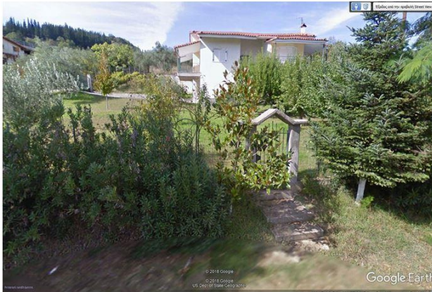
Έτος 2018. Το χωριό μου, η Κόμνηνα : Στο χώρο αυτό, στα παλιά δηλαδή χρόνια βρισκόταν ένα αμπέλι. Σήμερα είναι κτισμένο ένα όμορφο σπίτι. Το ίδιο γίνεται και στα γύρω, κάποτε, αμπέλια. Και εκεί, στίτια υπάρχουν σήμερα.

Από το δρόμο περνά ο Αποστόλης καβάλα στο γαϊδουράκι και προφανώς πήγαινε σε κάποιο άλλο κτήμα να εργαστεί.