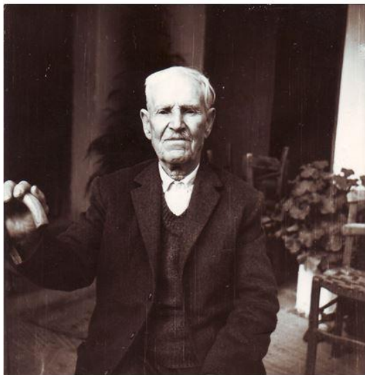
Εδώ ο, γεροντάκι πλέον, σεβαστός μου πατέρας με την μαγκούρα του την οποία, ως κειμήλιο κρατώ, για να θυμάμαι και κάποιες «μαγκουριές» που, ως μικρός και ζόρικός γιός του, «μάζευα» και, καλά τις ...έτρωνα.

Εγώ, μια που ήμουνα «εξουσία», μπορούσα να «λύσω» και να «δέσω»,