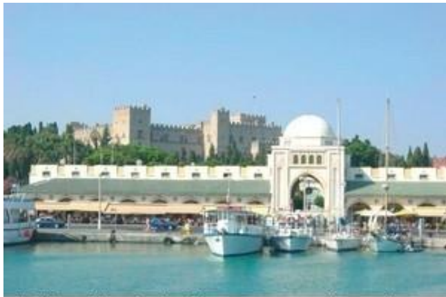
Ρόδος: Μανδράκι. Στο εσωτερικό του ήταν -και ίσως είναι- μανάβικα, κρεοπωλεία κ.λ.π.

αντιμετωπίζει, πολύ φοβούμαι μήπως καμιά μέρα μας στρίψει η βίδα και πάρουμε τα βουνά ή, στην καλύτερη περίπτωση, φορώντας καπέλο