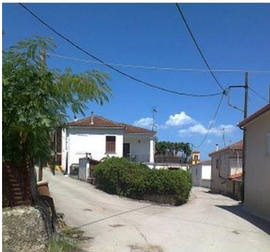
Το πατρικό μου σπίτι ,στην Κόμνηνα , όπως είναι σήμερα.