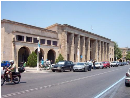
Δικαστικό Μέγαρο Ρόδου.

Μέσα σε αυτές τις αίθουσες πολλά διδάσκονται και μεγάλη εμπειρία αποκτούν όχι μόνο εκείνοι που ασχολούνται με αυτό το αντικείμενο (δικαστικοί λειτουργοί,