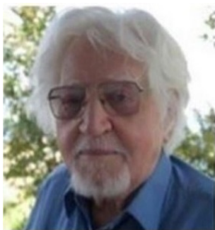
Του ΣΕΡΑΦΕΙΜ ΑΘΑΝΑΣΙΟΥ www.serathan.gr

Τώρα εγώ ο «σκληρός» Χωροφύλακας που ,εν τη μεγαλοψυχία μου, ακόμη και σιδερένια βραχιόλια πολλές φορές μοίραζα, με ποιες δυνατότητες, και ποιες γνώσεις μπορώ να περιγράψω αυτά που, κατά καιρούς, συμβαίνουν μεταξύ δασκάλου, του όποιου δασκάλου και μαθητού, του όποιου μαθητού.