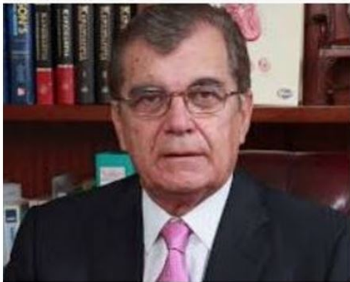
Ο Καθηγητής κ. Δημήτρης Κρεμαστινός

Η σύζυγός μου πήρε στη Ρόδο τηλέφωνο τον τέως Υπουργό και νυν Βουλευτή Δωδεκανήσου, καθηγητή Καρδιολογίας